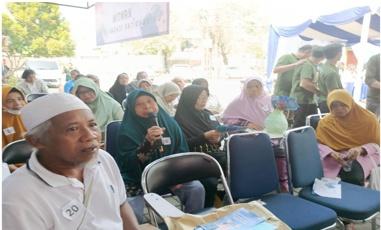
Kegiatan Penyuluhan Kesehatan