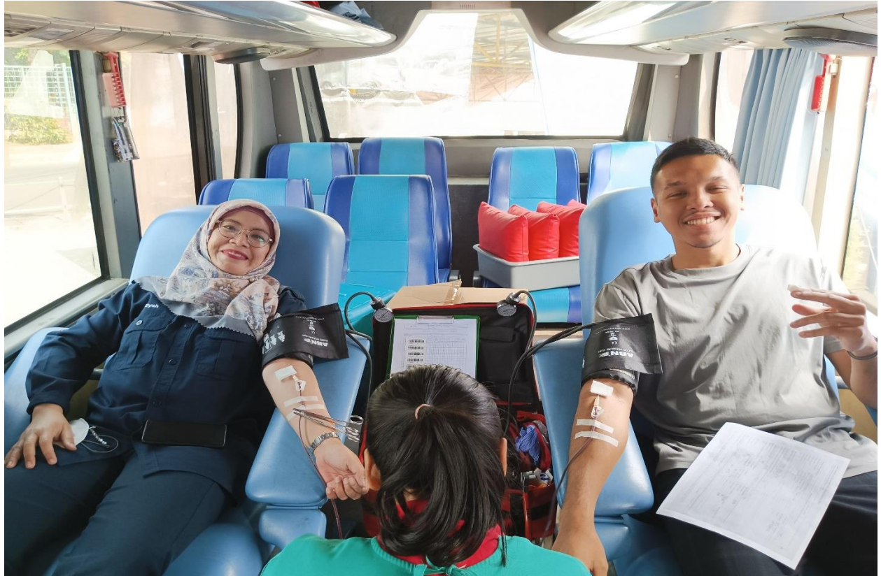
Kegiatan Donor Darah