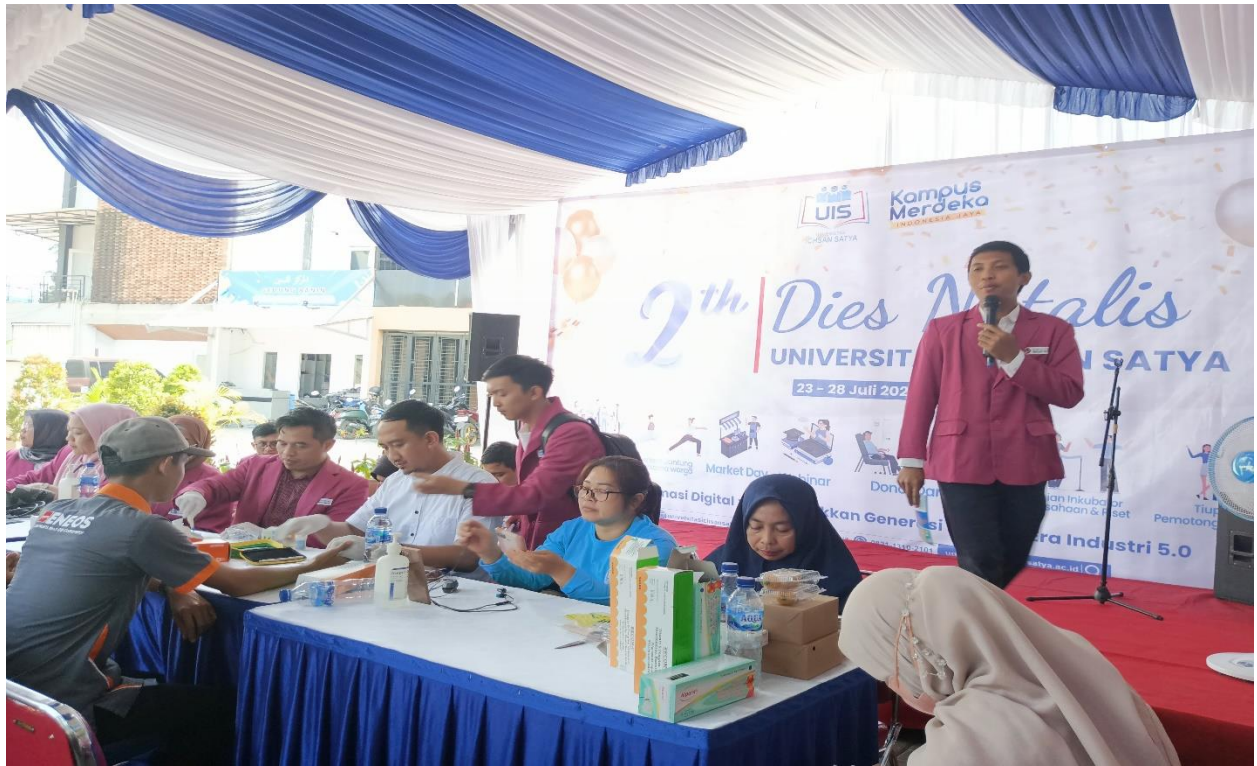
Kegiatan Pemeriksaan Kesehatan